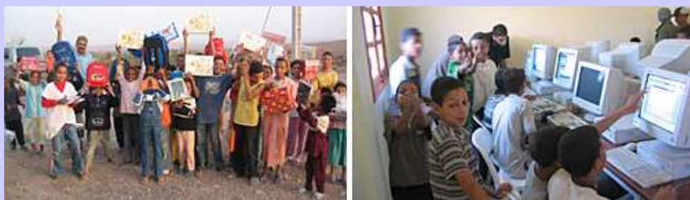
Distribution de 63 kits cartables à Skoura (Ouarzazate) et premiers clics sur les 15 ordinateurs à Ait Ali (Agadir)

Elle les aide à réaliser des projets sélectionnés, dans les domaines de l'éducation , de l'alphabétisation , et du développement durable .