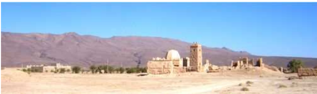
Vue de Bani Moussi

Voir site de l'association de Bani Moussi : http://www.banimoussi.c.la